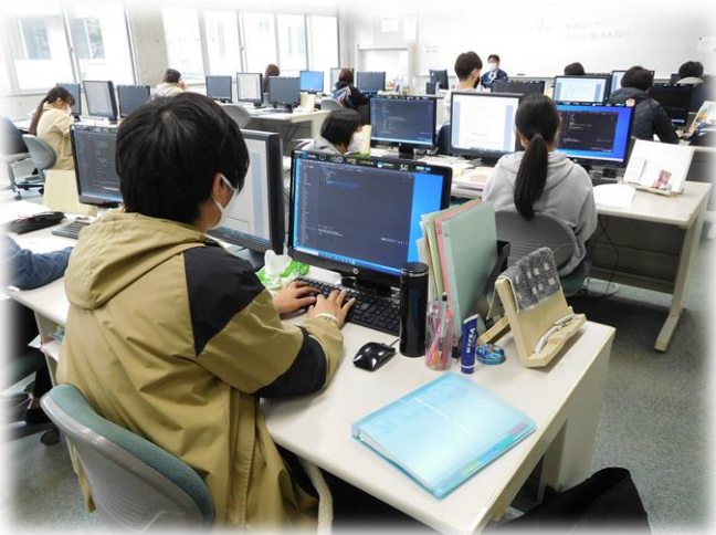
プログラムエンジニア科

また、プログラムエンジニア科は、プログラム言語で実務的なプログラミングができる人材を育成し、修了生はソフトウェア関連会社などで活躍しています。 学校見学を随時受け付けておりますので、本校に興味のある方は、お気軽に御連絡ください。