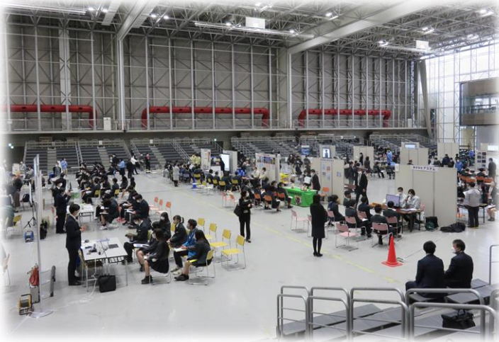
仙南地域等の製造業者 39社が集合

企業から直接「ものづくり」の魅力について説明を受けられる絶好の機会となりました。参加した高校生からは、「直接話を伺うことで、ものづくり企業の魅力が分かった。次は実際に工場を見てみたい。」といった声などが寄せられ、ものづくりへの興味・関心が高まっています。 今後、企業と高校の連携を深める事業を実施することにより、仙南地域のものづくり産業を支える人材の育成に取り組んでまいります。