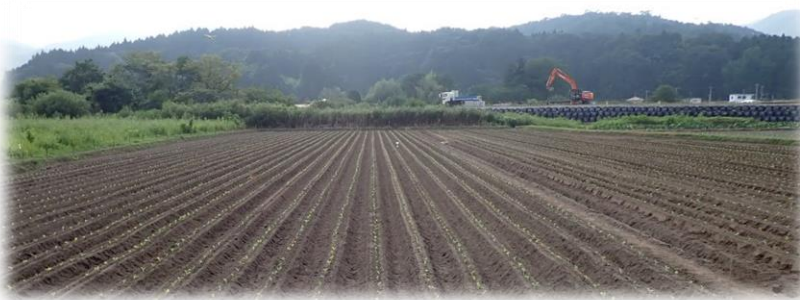
真っ直ぐに成形された畝