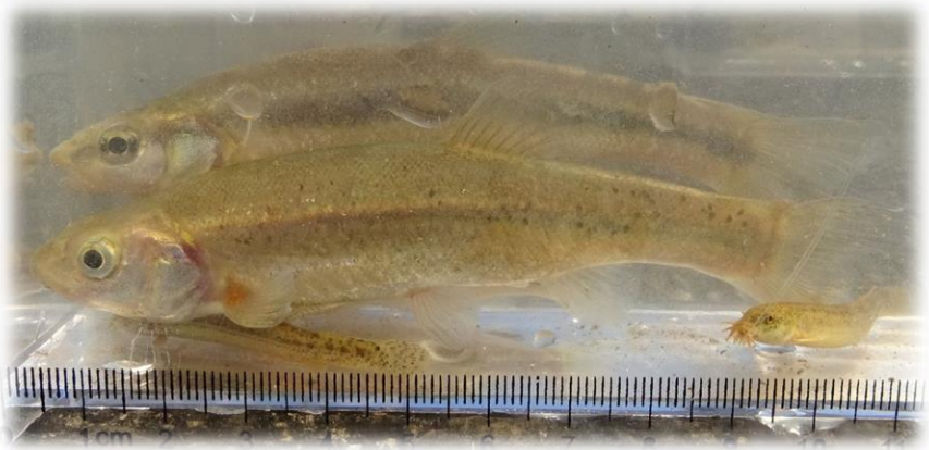
捕れたアブラハヤ・ドジョウ

では、農地や土地改良施設等を活用した地域住民活動の活性化を図る指導員の育成や、その指導員を主体として行う活動への支援を行っています。