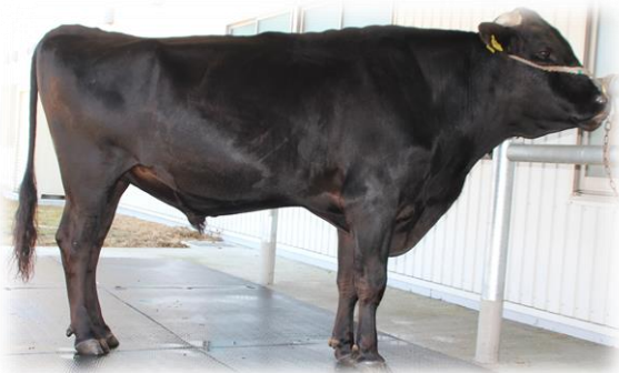
基幹種雄牛「昭光茂」

本年6月、角田市の合資会社ばば農場生産の「昭光茂」が宮城県の改良の基礎となる基幹種雄牛として選抜されました。 その成績は、産子一頭当たりの肉量が県歴代1位、霜降りの度合いが県歴代2位と極めて良好で、地元では和牛改良に貢献し、銘柄牛肉「仙台牛」の生産拡大の弾みになることを期待しています。