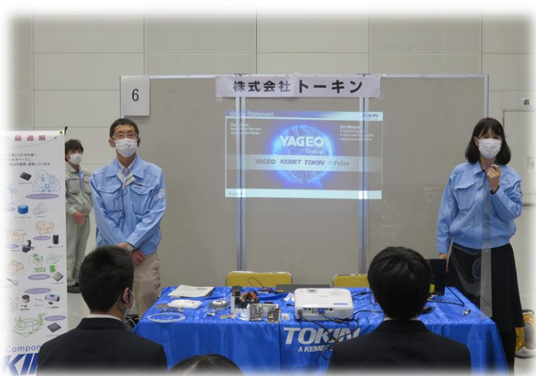
株式会社トーキンによる説明