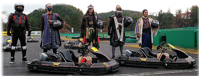
武将隊のみなさん

10月23日(日)に村田町にある「スポーツランドSUGO」にて、「武将カート」のイベントが開催され、「伊達武将隊」軍と「やまがた愛の武将隊」軍に分かれレース対決が行われました。歴史的な蔵の町並みと、モータースポーツの聖地「スポーツランドSUGO」が共存する地域の魅力をアピールしようと、村田町が企画しました。