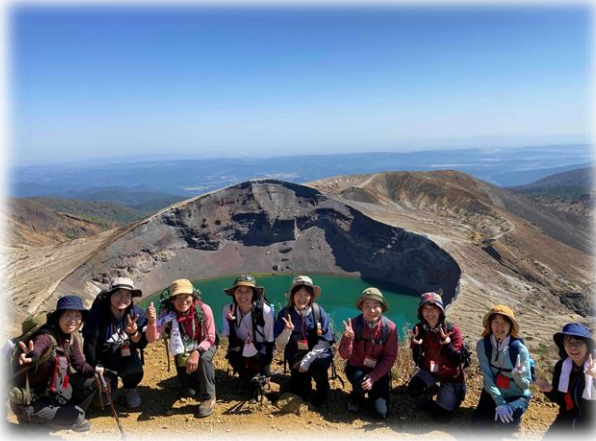
お釜と参加者のみなさん