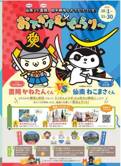
ラリー紹介チラシ