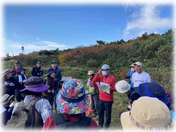
登山ボランティアによる草木の説明

第2回目の開催になった山ガール教室は、曇一つない秋晴れになり登山日和の日に開催することができました。初心者コースは、刈田無料駐車場から地蔵岳に向かうコースでした。登山途中には、登山ボランティアの説明もあり、草花の説明を聞きながら登山を楽しむ参加者の姿が見られました。経験者コースは、聖山平から後烏帽子山頂へ登り、石子岳山頂へ抜けてゴンドラでえぼしスキー場へ下りました。体力的につらい箇所もありましたが、見事な眺望を見て「きれいだね」と参加者同士、声を掛け合ったり、真をとったりなど、蔵王の秋を堪能することができました。