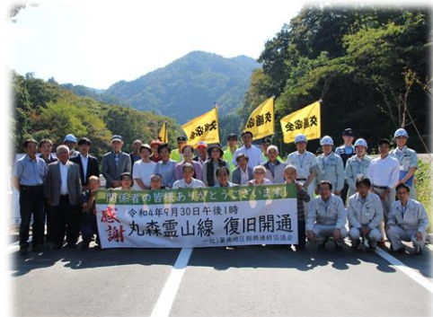
丸森霊山線 復旧開通

これにより、通行の安全性が確保されたことから、主要地方道丸森霊山線の全面通行止めを解除し、令和4年9月30日13時に約3年ぶりに通行を再開しました。