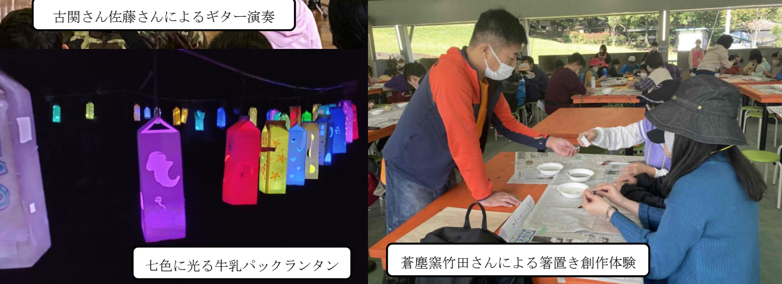
七色に光る牛乳パックランタン