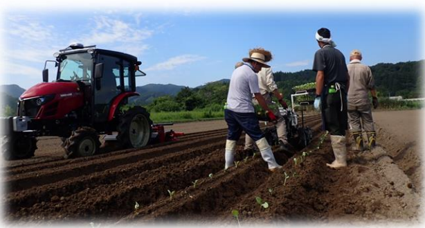
自動操舵のトラクターで畝を成形後 ブロッコリー苗を機械定植