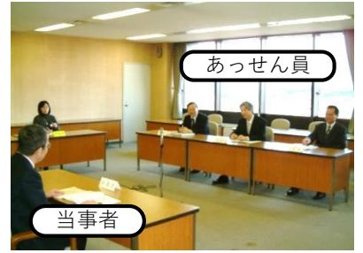
あっせんのイメージ

の三者で構成される「あっせん員」が、当事者双方から丁寧に主張等を聴き取り、労働者、使用者のどちらも納得できる解決を目指します。