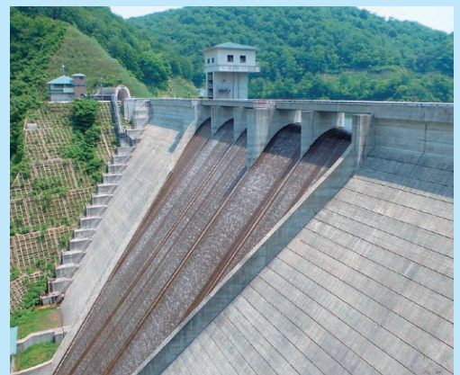
▲クレスト（堤頂）からの越流