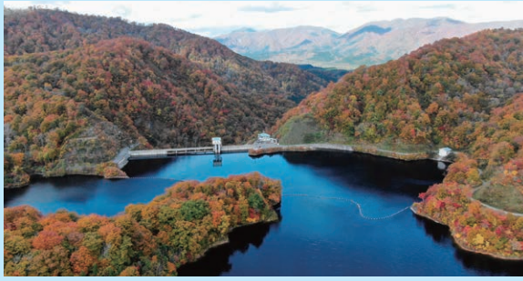
▲行く秋の蛍泉湖（けいせんこ）