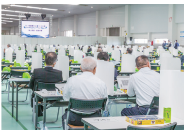
飛沫防止パーティション