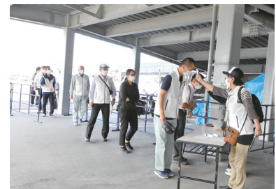
スタッフ受付における検温の様子