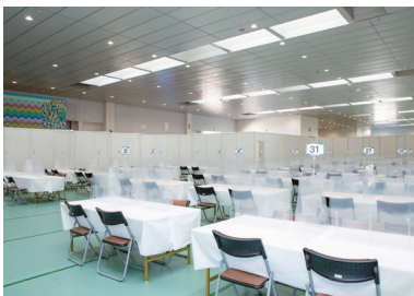
控室用 飛沫防止パーティション