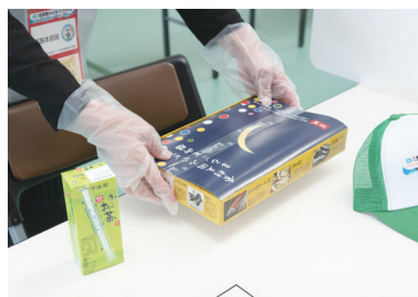
配膳用ビニール手袋