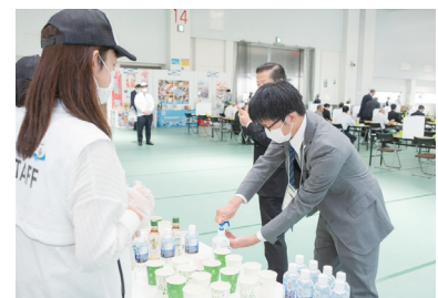
来場者による手指消毒の様子