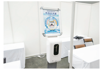
アルコール消毒スタンド