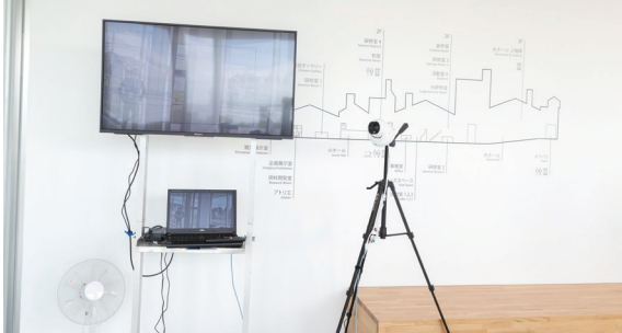
赤外線サーモグラフィ検温機