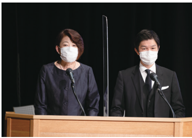
司会者用アクリルパネル