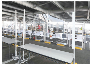
スタッフ受付用アクリルパネル