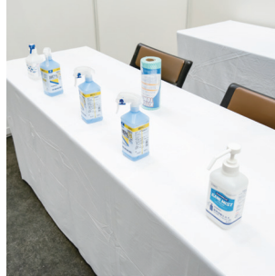
手指消毒用アルコール