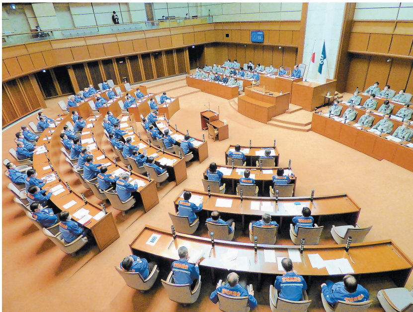
2月定例会の本会議

第382回宮城県議会（2月定例会）は2月14日から3月18日まで33日間の会期が開かれた。約1億1460万円の令和4年度一般会計当初予算や、教育機会の確保を明記した「みやぎ子ども・子育て県民条例」の一部改正、ロシアによるウクライナへの軍事侵襲に抗議する決議など、104議案を原案通り可決した。代表・一般質問では、新型コロナウイルスの感染拡大への対応や仙台医療圏に立地する4病院の再編方針、東日本大震災の復興などに関し、活発な議論が展開された。