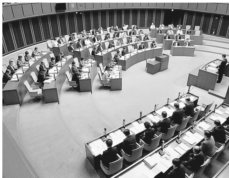
県議会9月定例会の本会議

※議案等に対する各議員の表決状況については、県議会ホームページに掲載しているほか、議会図書室で閲覧できます。