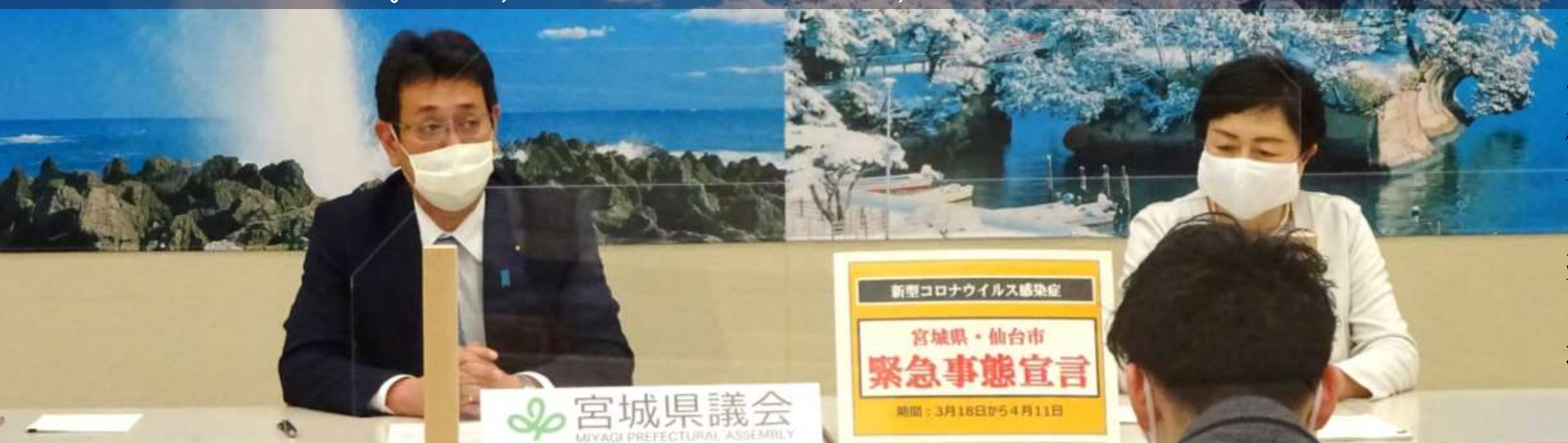
議長記者会見の様子

「新・宮城の将来ビジョン」に掲げる施策に予算を重点配分し編成した、令和3年度当初予算を可決したほか、福島県沖を震源とする地震の復旧・復興に要する経費などを計上した令和3年度補正予算を可決しました。