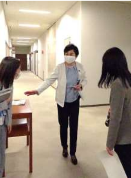
記者に声をかける外崎副議長