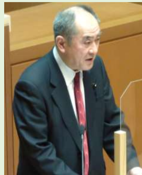
佐々木喜藏議員 (自民)