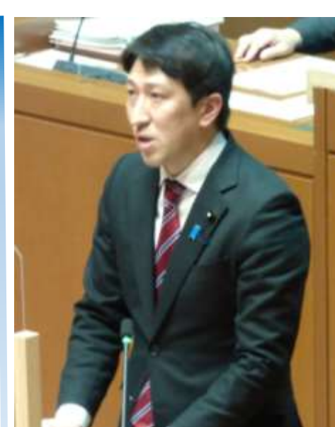
福井崇正議員 (自民)