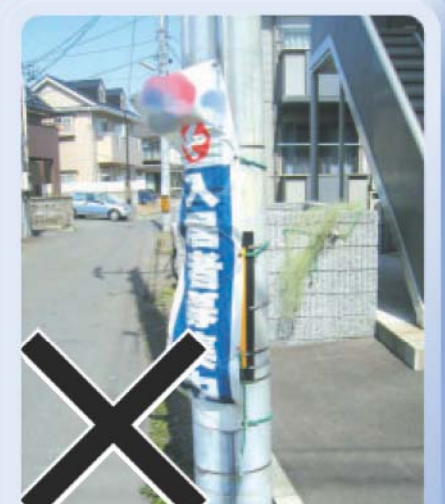
除却不可：広告旗 放置されているものは県の職員が撤去します。