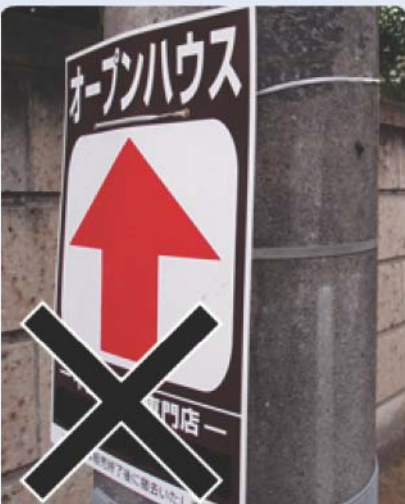
除却不可：はり札 (プラスチック・金属・木製) 放置されているものは県の職員が撤去します。