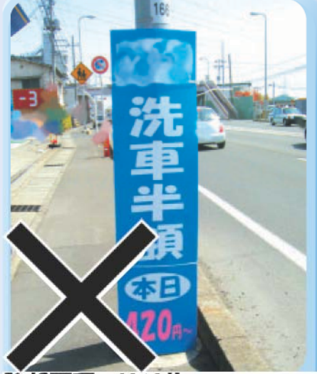
除却不可：はり札 (木枠等に布張り) 放置されているものは県の職員が撤去します。