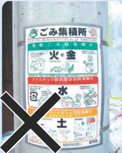
除却不可：はり紙 公共目的の表示ははがせません。