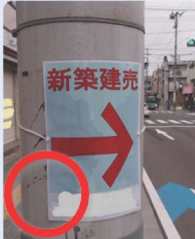
除却可：はり紙 (ラミネート加工) 電柱にひも・テープ等で括りつけ