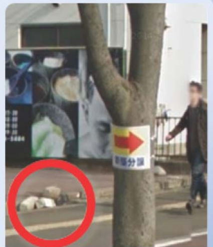
除却可：はり紙 街路樹にひも・テープ等で括りつけ