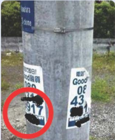
除却可：はり紙 電柱に直にはりつけ