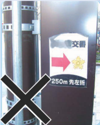
除却不可：はり紙 公共目的の表示ははがせません。