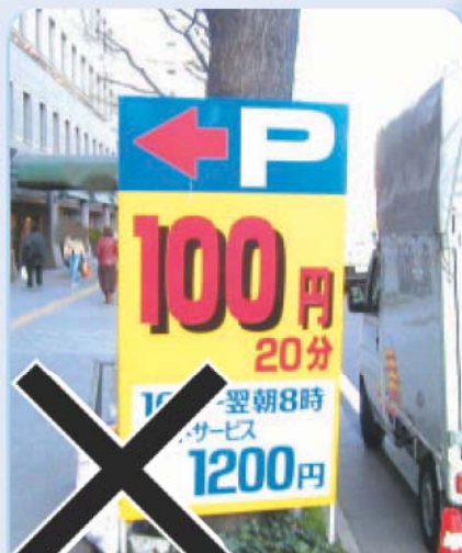
除却不可：立看板 放置されているものは県の職員が撤去します。