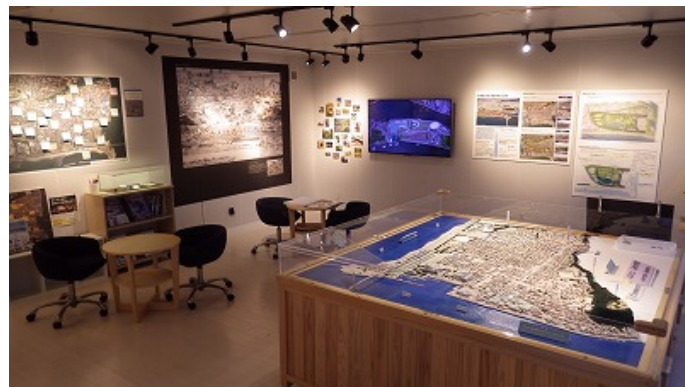
▲震災伝承に関する展示