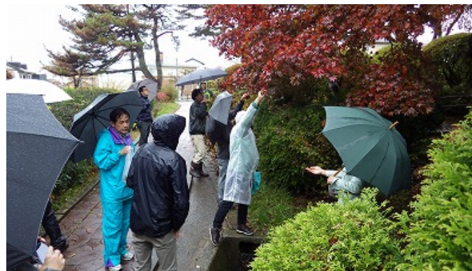
▲平成27年11月に実施した種採り