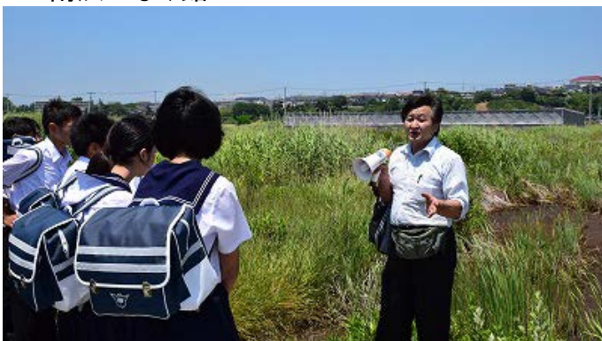
▲語り部による現地案内