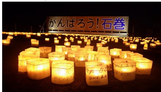
▲震災1000日・2000日追悼の灯り