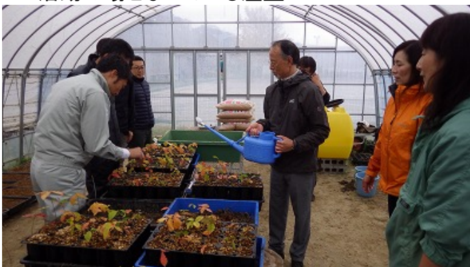
▲温室内での播種作業