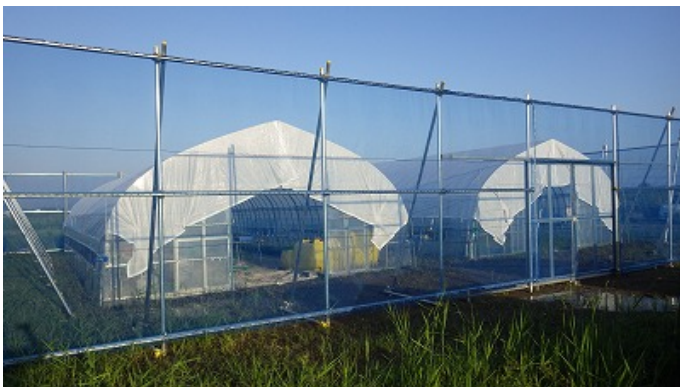
▲活動の場となっている温室