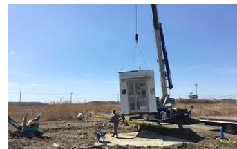
H28.4.11南浜つなぐ館移設