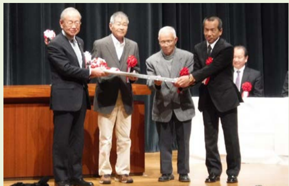
宮内災害公営住宅(上)、完成式典(下)