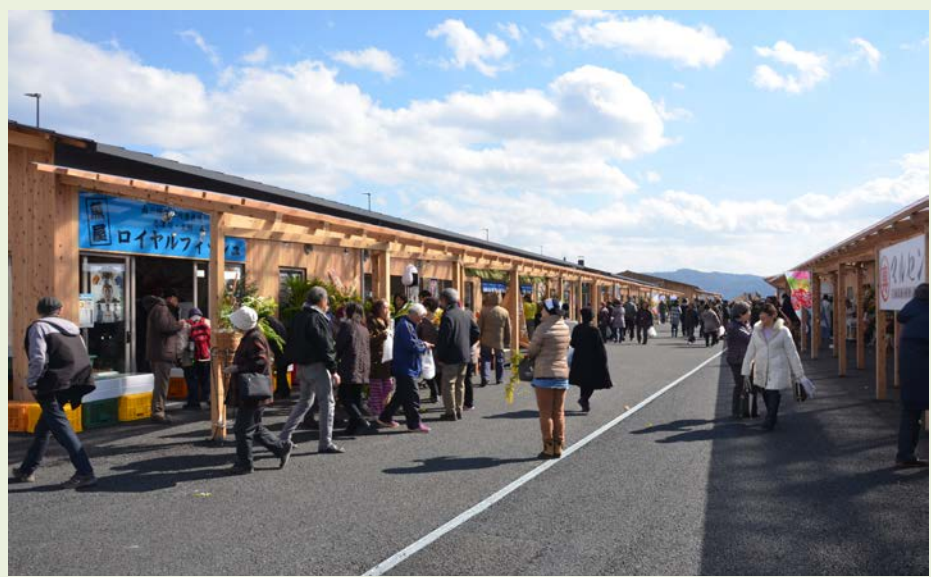
オープン直後の南三陸町さんさん商店街

魅力ある新商店街ができたことで、地元住民の買い物の場として、また、観光の拠点として、南三陸町のにぎわいの創出が期待されています。