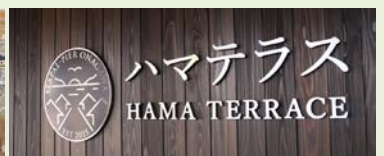
完成したハマテラス(上) 平成29年1月の女川町中心部(下)