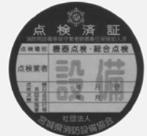
消火器以外の消防設備等用