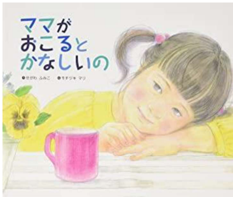
作：せがわふみこ 絵：モツキマリ 発行：金の星社