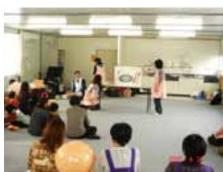
大きな絵本の読み語り