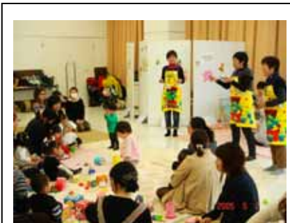
お手玉でのおあそび