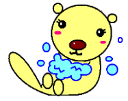
仙南保健所オリジナルキャラクター「てあらっこ」