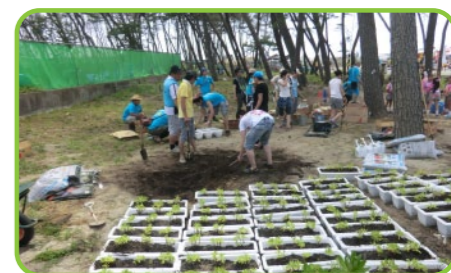
七浜滨菊义务植树志愿者活动