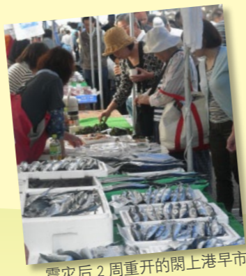
震灾后2周重开的闭上港早市