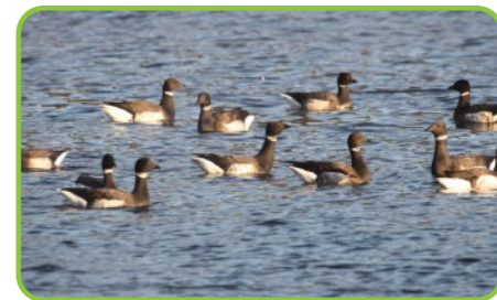
震灾后北上川河口飞来的黑雁