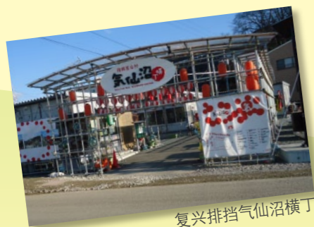
复兴排挡气仙沼横丁