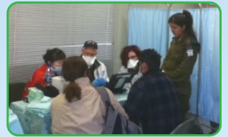
以色列医疗救援队的诊治情形