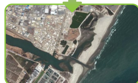
逐渐恢复受灾前面貌的蒲生海滩 (上为2011年3月14日拍摄，下为2012年4月10日拍摄)