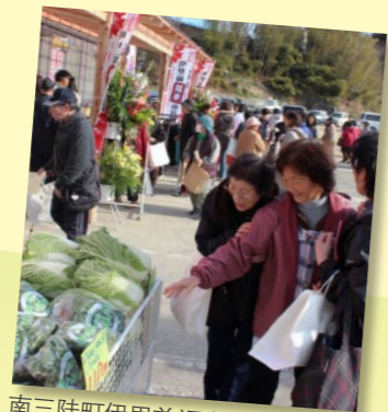
南三陆町伊里前福幸商业街