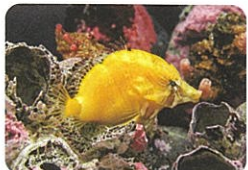
クチバシカジカ (通年)