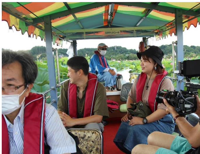
7/25~8/22 ハスマ祭り (迫会場)