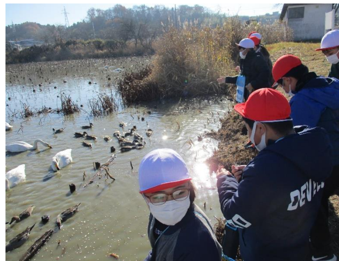
11/30 登米市環境出前講座