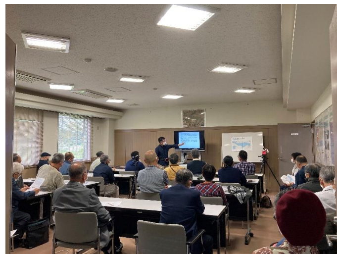
10/9~12/26 「伊豆沼の新しい見方」連続講座