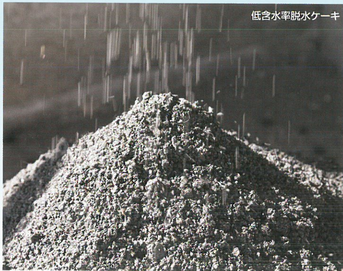
低含水率脱水ケーキ