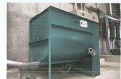
リセルバー供給機