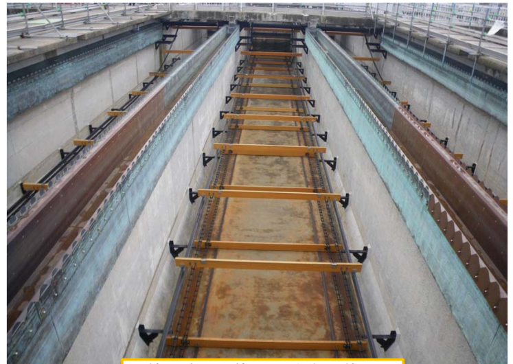
第3系列最終沈殿池復旧状況