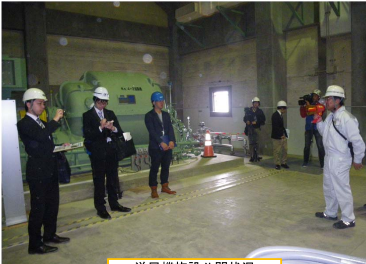
送風機施設公開状況