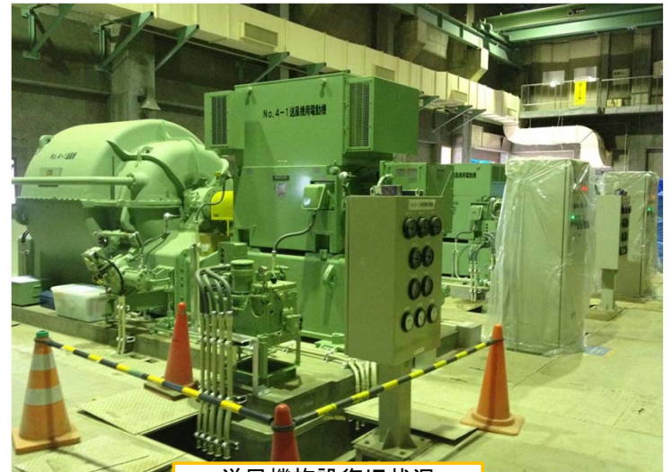
送風機施設復旧状況