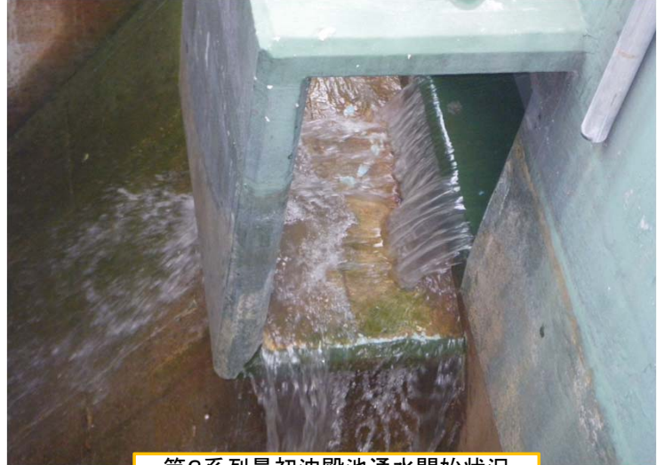
第3系列最初沈殿池通水開始状況