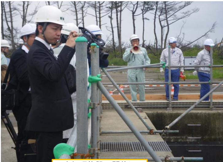
水処理施設公開状況