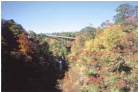
紅葉の鳴子峡（宮城県）

新潟県を含む東北各県との連携による共同観光ルートの開発等，外国人観光客の誘致に向けた共同の取組