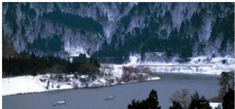
雪景色の最上川（山形県）