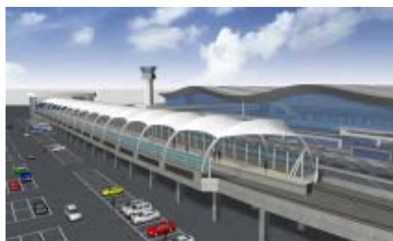
仙台空港アクセス鉄道 仙台空港駅（宮城県）