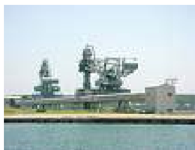
リサイクルポート酒田港（山形県）