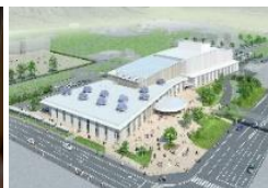
地中熱利用設備を導入する施設（利府町）