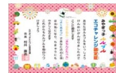
ルルブル・エコチャレンジ事業

NPOなどと協働して環境教育に関する出前講座を実施（出前講座191校、教員向け研修会3回）