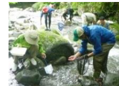
自然の家・人と自然の交流事業

子供の基本的な生活習慣の確立と併せて、二酸化炭素の削減効果などエコ活動の大切さを伝える環境教育を実施（ルルブル・エコチャレンジ認定109,313名）