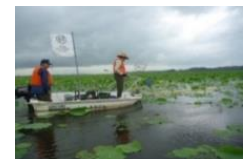
伊豆沼・内沼よみがえり在来生物プロジェクト事業

高齢化等により年々減少している狩猟者の確保に向け、狩猟免許取得に必要な経費の一部を補助（免許取得経費支援5,049名、市町村担い手育成7件）