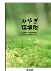
「みやぎ環境税」紹介パンフレット