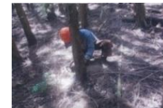
温暖化防止間伐推進事業

県産木材を一定以上使用した新築戸建て木造住宅に対し、経費の一部を補助（補助棟数2,777棟）