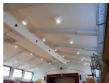
LED化した体育館の照明（大和町）