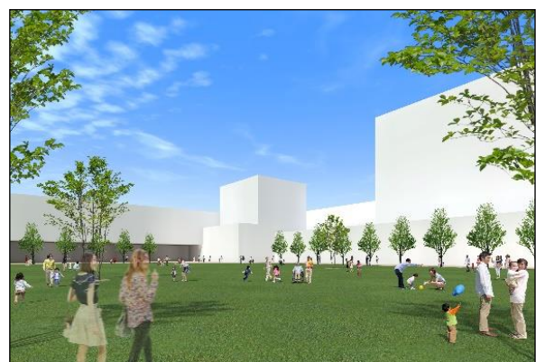
図4 施設配置イメージ