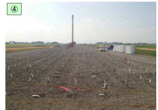
Ⅱ期区間の施工状況(地盤改良工)