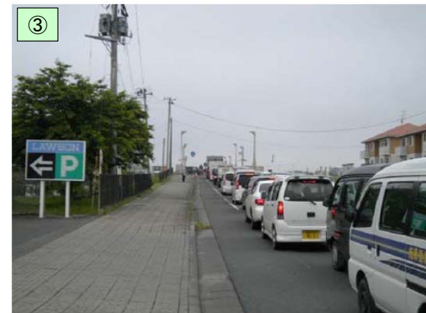
渋滞の激しいⅢ期現道区間(県道築館登米線)