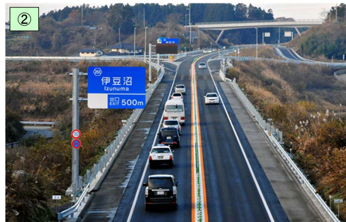
平成23年11月に供用を開始したⅠ期区間