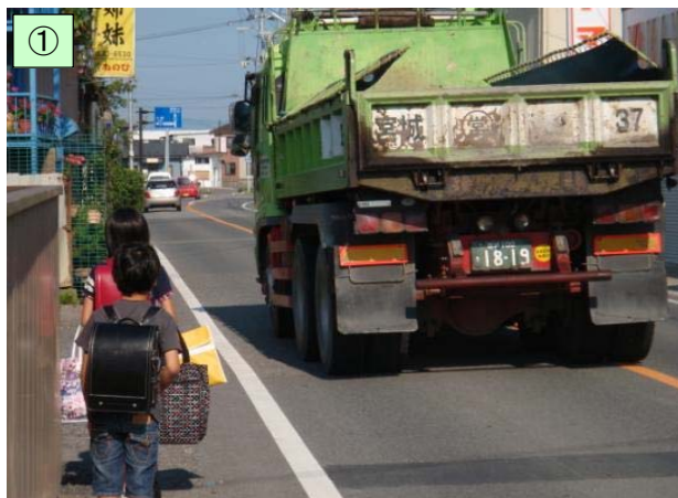
狭隘なⅣ期現道区間(県道若柳築館線)