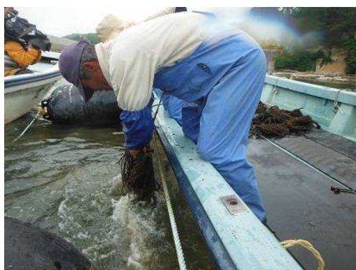
種苗出荷作業の様子

今回は、生産した種苗連950連（シュロ縄延長9,500m）のうち、300連（シュロ縄延長3,000m）が南三陸町志津川へ出荷されました。残りの種苗についても、近日中に牡鹿町や女川町の各漁協へ出荷される予定です。