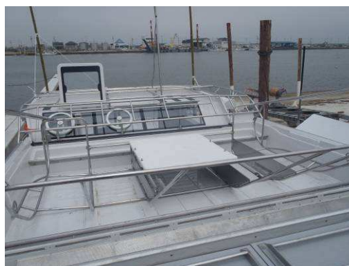
船上に設置された海苔収穫装置