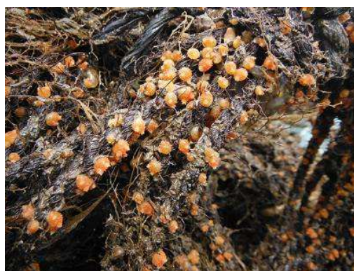
シュロ縄に付着した稚ホヤ