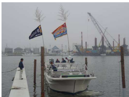
進水した海苔システム漁船

海苔システム船は、ニチモウワンマン社によって開発された高機能の海苔養殖作業船で、海苔の収穫や活性化処理を船上で効率的に行うことができます。このようなシステム船は九州の有明海などで普及が進んでいますが、JF Arahama は、有明海より「外海」である宮城の海に合わせて作られた特注品であり、亶理の海苔養殖作業の効率化と、復興への更なる前進が期待されます。