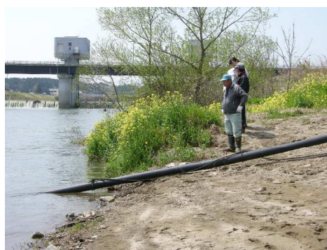
鳴瀬川で行われた放流の様子