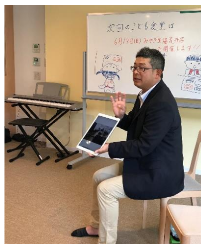
▲ こども食堂での魚食普及の様子