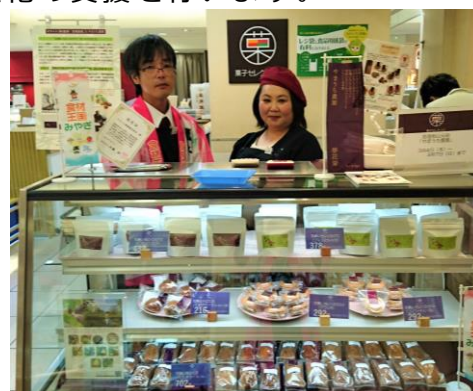
藤崎百貨店での販売会 ▶