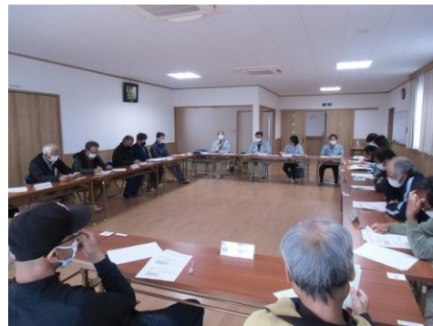
▶ 産地表示販売検討会の様子