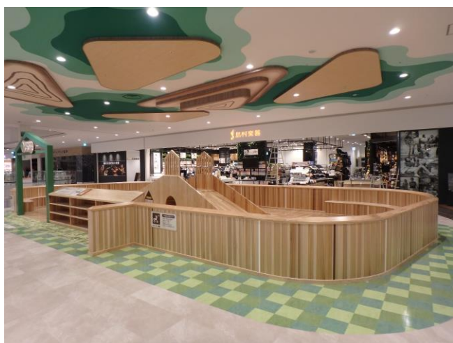
▲ 木の温もり溢れる「モクイクひろば」

※FSC 認証材：FSC が適切な森林管理が行われていることを認証した森林から生産された木材 FSC(Forest Stewardship Council®, 森林管理協議会の略)