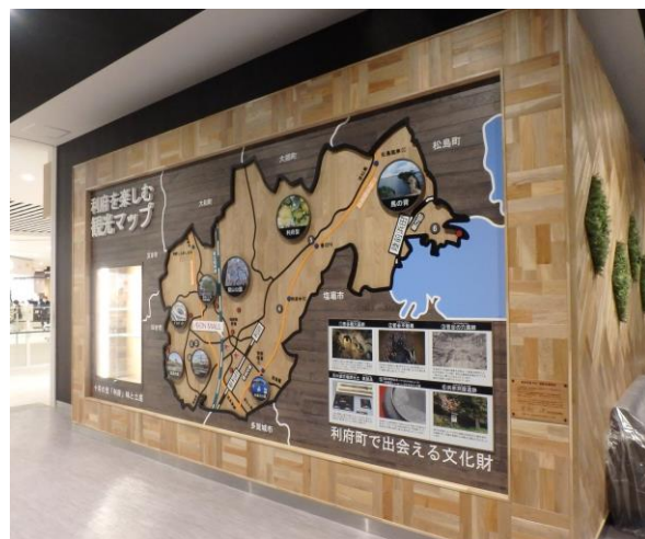
▲ 県産 FSC 認証材を使用した木製観光マップ