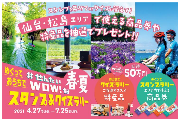
▲ スタンプ&クイズラリーのお知らせ

同時開催を予定していた、対象スポットを巡る「めぐってスタンプラリー」は、新型コロナウイルス感染症の拡大防止のため開始を延期しています。開始時期などについては、特設ウェブページでご確認ください。