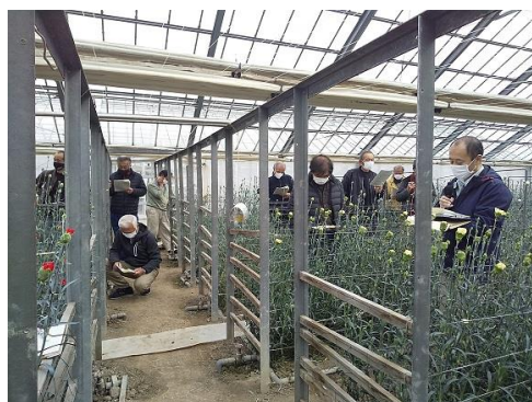
◀ EOD-heating 現地検討会の様子

普及センターでは、今後も新たな栽培管理技術や販売手法の導入に向けた支援を行っていきます。