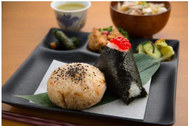
▲ 農家レストラン「おにぎり茶屋ちかちゃん」 住所：仙台市若林区蒲町31