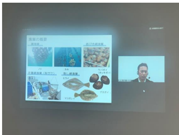
▲ リモート発表の様子

この農林水産大臣賞を受賞したことで、今後、「第60回農林水産祭」の表彰審査対象となる予定です。