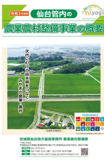
▶ パンフレット表紙

東日本大震災後の 10 年間で復旧期(H23～25 年度)、再生期(H26～29 年度)、発展期(H30～R2 年度)の 3 期に区分し、緊急かつ重点的に取り組む具体的な施策を定め、取り組みの施策を示した宮城県の計画