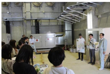
▲ 大堀排水機場での説明