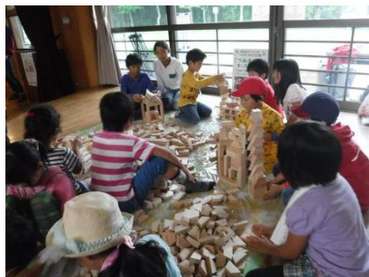
▲間伐材の積み木コーナーの様子