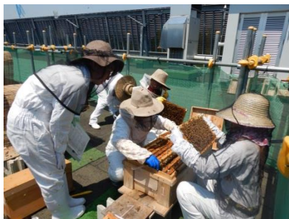
▲ミツバチの巣箱の中を確認するメンバー