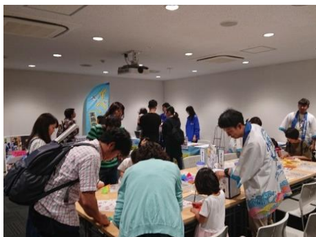
▲ 子ども安全免許証づくり、缶バッジ・おさかな折り紙づくりの様子