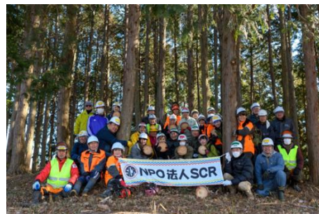
▲森林体験活動の様子