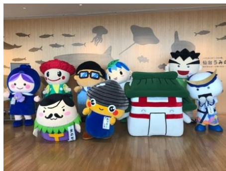
▲ キャラクターの集合写真

各企画とも多くの来場者の皆様にご参加いただき、観光パンフレット等をお持ち帰りいただいたことで、当エリアの魅力を存分に紹介することができました。