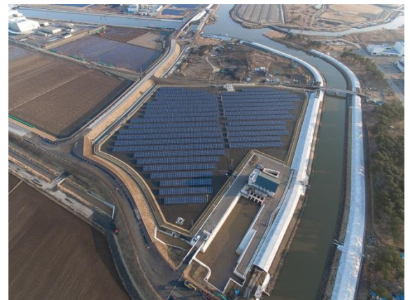
「岩沼藤曾根地区」太陽光発電所

本発電所の有効活用により、今後津波被災沿岸部が震災前以上に発展していくことが期待されます。