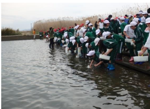
亘理小学校のさけ稚魚放流の様子

このような中，4月21日に亘理町立亘理小学校5年生146名が亘理ふ化場で育てたさけ稚魚を，4月27日に丸森町立大内小学校4，5年生23名が丸森ふ化場で育てたさけ稚魚を放流する体験学習を行いました。参加した児童は，ふ化場で飼育しているさけ稚魚の餌やり体験と宮城県漁業協同組合仙南支所長や水産漁港部職員からさけの生態などの話を聞いたあと，4年後に阿武隈川に帰ってくることを期待して放流しました。