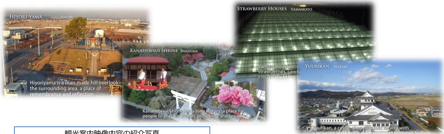
観光案内映像内容の紹介写真 (左から) 日高山，金蛇水神社，イチゴハウス，悠里館

英語圏観光客向けに英語版と，宮城県がサポートデスクを設置し誘客に力を入れている台湾人観光客向けに台湾語版を作成しました。また，日本人観光客にも動画を楽しんでもらえるように，英語のナレーションに日本語字幕を入れた動画も作成しており，現在，宮城県広報課が発信している県政動画チャンネルのインターネット広報資料室でYouTube動画として公開しています。その他，仙台地方振興事務所ホームページや仙台・宮城観光キャンペーン推進協議会ホームページで発信しています。