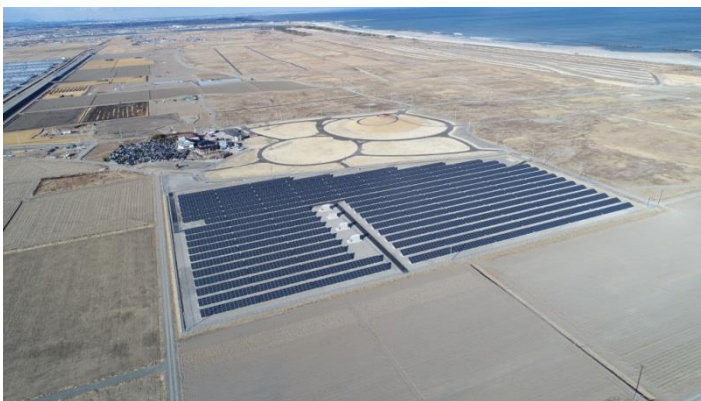
「亘理・山元第2地区」太陽光発電所