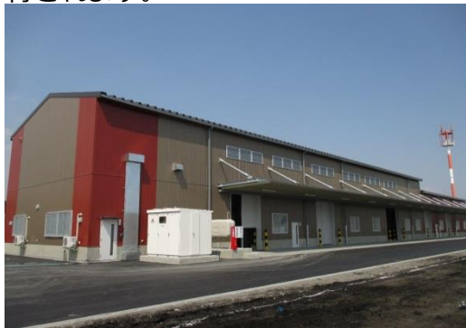
完成した穀類乾燥調製・共同育苗施設

同法人の特徴は、実働部隊の平均年齢が40歳代前半と非常に若いことであり、継続的な営農の展開が期待されます。