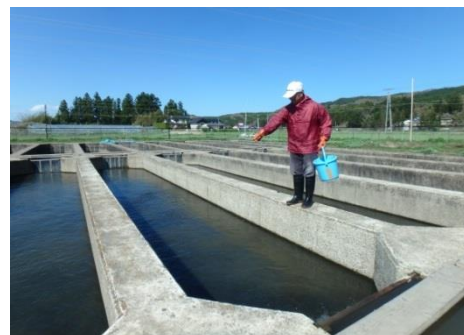
さけ稚魚飼育の様子

毎 年，秋から冬にふるさとの川を目指して帰ってくるさけは，沿岸漁業だけでなく，はらこ飯など本県の食文化には欠かせない重要な水産資源です。このさけ資源の維持増大を図るため，管内の6つのふ化場でふ化放流事業を行っています。今シーズンは遡上親魚の減少による種卵の確保や少雨による飼育水不足で稚魚の飼育に苦労しましたが，関係者の努力により，各ふ化場とも計画どおり放流できる見込みとなっています。