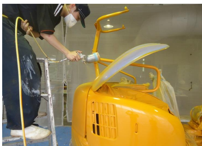
小型建設機械をスプレーガンで塗装しています