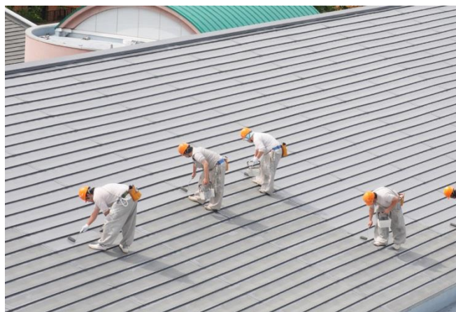
実習棟の屋根をローラーを使って塗装しています

株式会社高野塗装店・古川工業株式会社・中央鋼建株式会社・有限会社サイトウ水門 株式会社バーンリペア・有限会社山徳・株式会社佐藤内装・有限会社ワタナベ塗装 株式会社さんのう・有限会社ティーケー塗装・有限会社稲富塗装店・株式会社ユウキ トウペカラーサービス株式会社・株式会社シンワ・有限会社泉塗装・株式会社太宰 ペイント工業株式会社・株式会社中川原塗装・有限会社宮城塗装・株式会社大広塗装工業 株式会社明和・ワタナベペイントサービス ほか