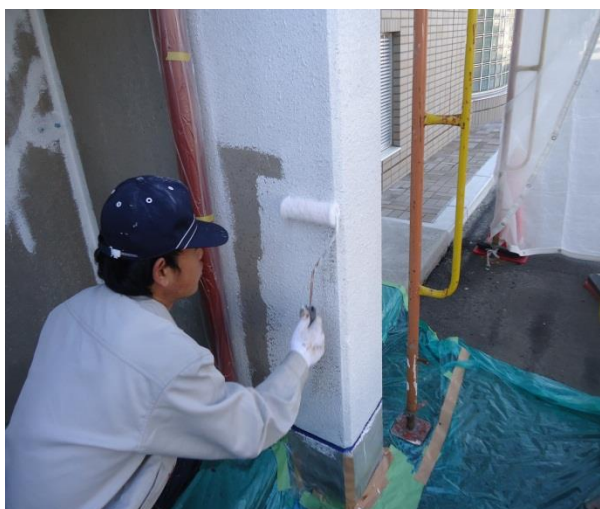
建物の壁にローラーを使って塗装をしているところです

工場での塗装は塗装ブースと呼ばれる専用スペースで機械工具を使って粉体塗装や静电塗装、溶剤吹付作業が主となります。