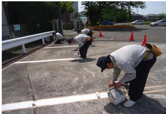
学校駐車場の白線の引き直しをしています