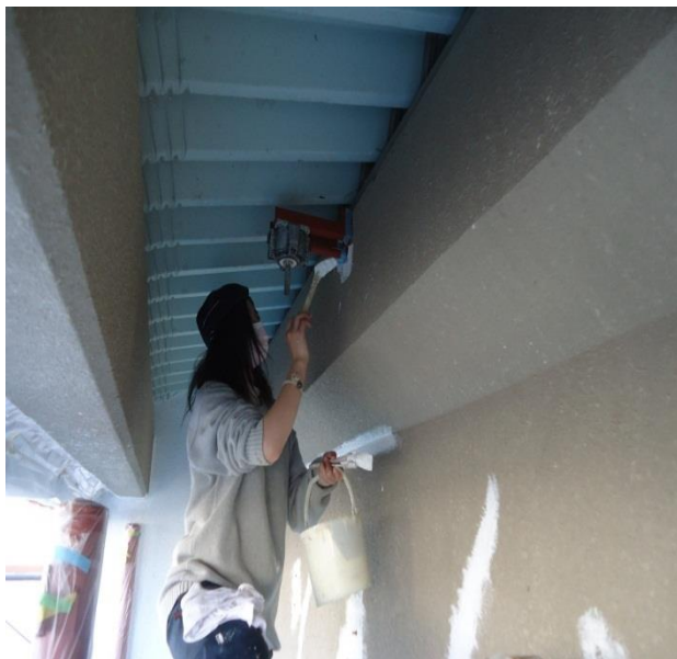
建物の壁に刷毛を使って塗装しているところです

A 建築塗装の住宅に関して見れば、昔に比べ建築資材があらかじめ工場で塗装されてきている資材が多くなり、塗装の範囲が減ってきている傾向はあります。