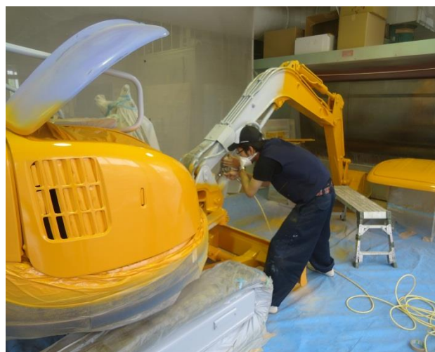
小型建設機械に塗装をしているところです