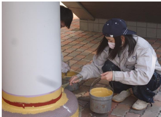
実習場の連絡橋の柱を刷毛で塗装しています