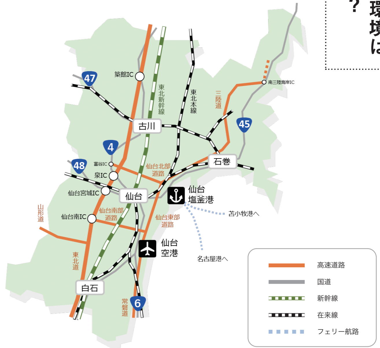
【図1】 宮城県的主要な交通網

宮城県の交通を取り巻く環境は どうなっているのだろうか？ 多様な交通網が整備され 経済と生活を支えています 仙台都市圏を一周する 環状自動車専用道路が開通 交通インフラは、道路や鉄道、空港、港湾など、地域間の人や物資の輸送を支える社会基盤です。「都市の動脈」と呼ばれるように、企業の経済活動や住民の生活には不可欠であり、大都市と地方を結ぶ交通インフラを整備することで、周辺地域の発展に貢献しています。 宮城県内においても、仙台市を起点とした多様な交通網が形成されています【図1】。 高速道路では、東北縦貫自動車道(東北道)や三陸縦貫自動車道、常磐自動車道などがあり、2010年に仙台北部道路と東北道が繋がったことで、周囲約60キロメートルの「仙台都市圏環状自動車専用道路」が開通しました【図2】。これにより、一般道の交通渋滞の緩和や産業・物流拠点のアクセス強化などの効果が期待されています。