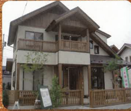
「優良みやぎ材」使用住宅