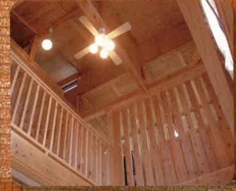
「優良みやぎ材」使用住宅