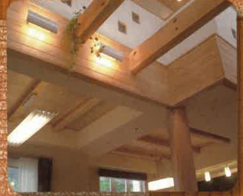
「優良みやぎ材」使用住宅