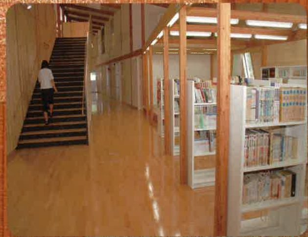
白石市 白石市立南中学校