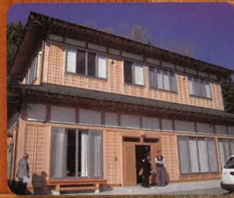
宮城県産材使用住宅