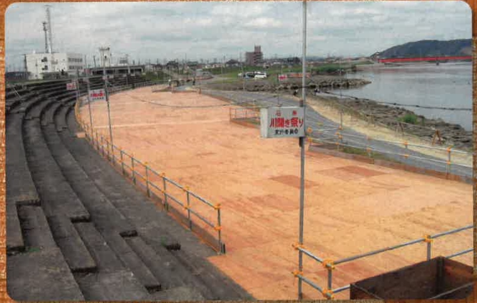
「優良みやぎ材・合板」を使用した花火大会様敷席