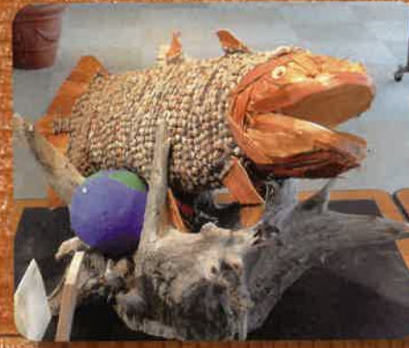
木工工作最優秀作品