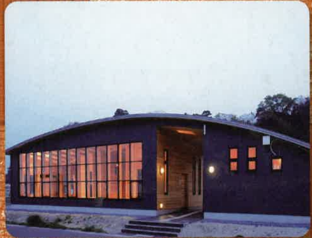
塩竈市 桂島漁港休憩所