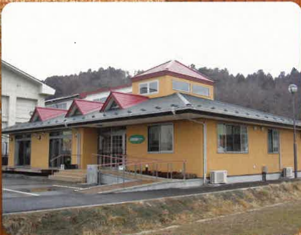
登米市 上沼児童館