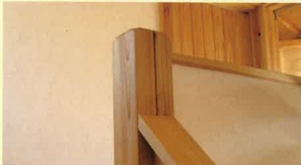
▲「背割り」を入れた部材