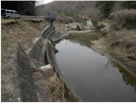
白石市 高田川 201号