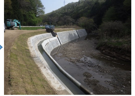
白石市 高田川 204号