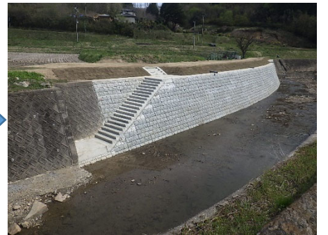
丸森町 災害関連緊急砂防工事 阿武隈川左岸 沼沢地区