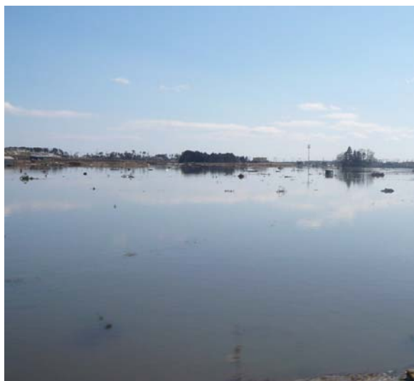
被災後(平成23年3月18日)