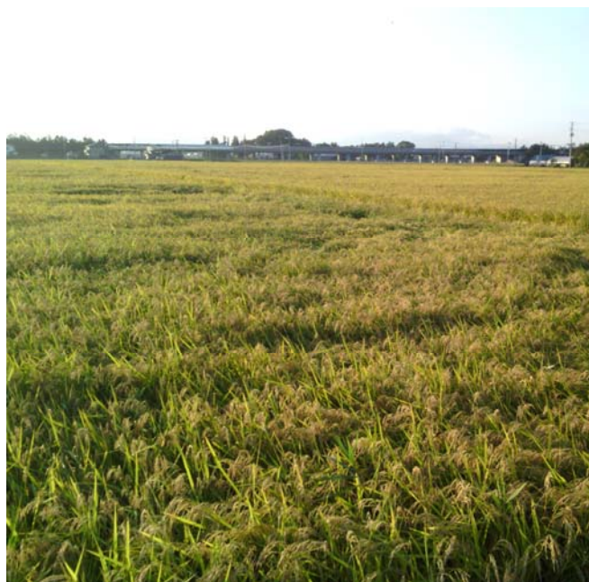
水稻生育状況(収穫前)(平成27年9月27日)