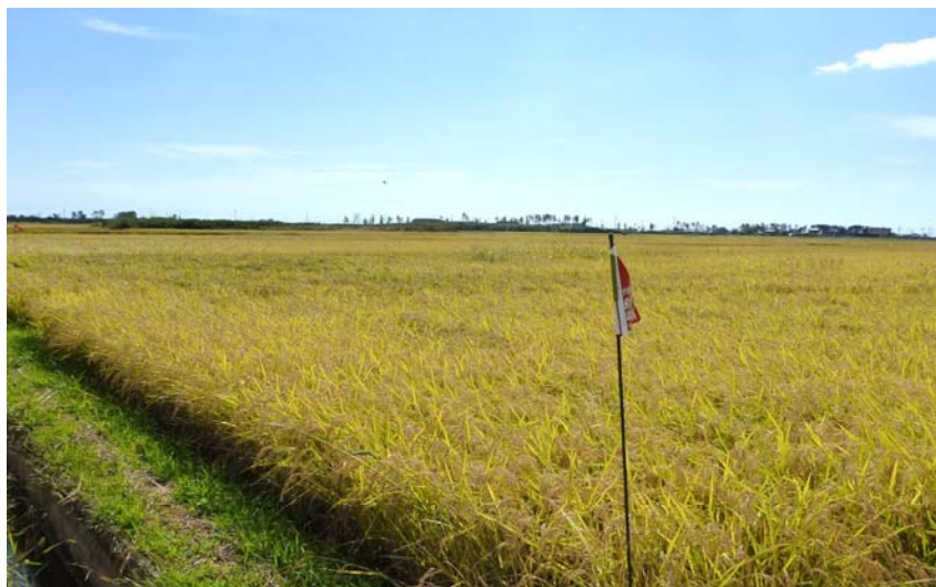
水稻生育状況(収穫前)(平成26年9月26日)