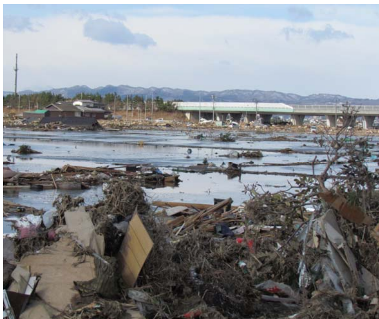
被災後(平成23年3月17日)