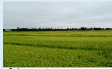
⑪農地復旧状況 (岩沼市:寺島)