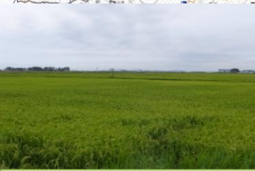
⑤農地復旧状況 (東松島市:大曲地区)