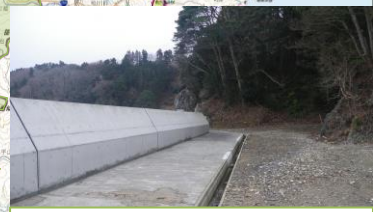
③農地海岸復旧状況 (南三陸町:滝浜)