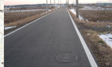
②集落排水施設復旧状況 (大崎市:高柳地区)