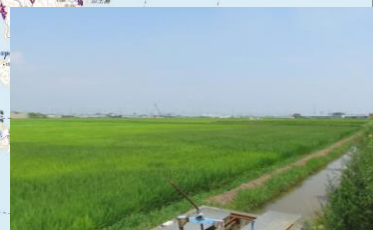
⑧農地復旧状況 (仙台市:蒲生)