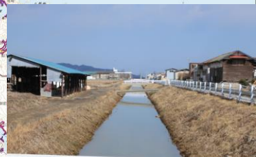
④排水路復旧状況 (石巻市:北上地区)