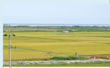
⑬農地復旧状況 (山元町:坂元)