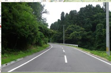
①農道復旧状況 (栗原市:松ノ木地区)