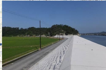
⑦海岸堤防復旧状況 (東松島市:松ヶ島地区)