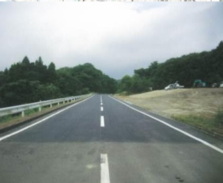
⑩農道復旧状況 (蔵王町:仙南地区)