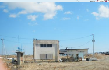
⑥排水機場復旧状況 (東松島市:中下排水機場)