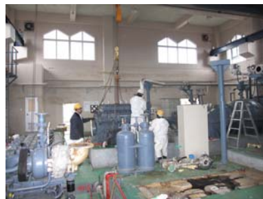
被災した排水機場の応急復旧(東松島市)