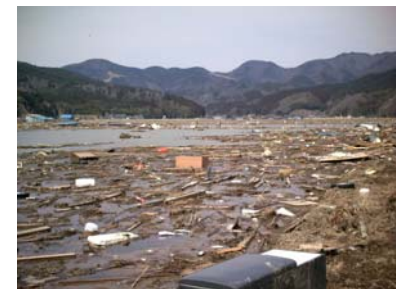
農地の被災(石巻市)