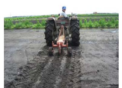
除塩実証試験:暗渠設置(名取市)