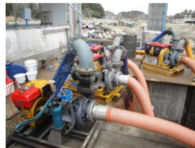
被災した排水機場への応急ポンプ設置(東松島市)