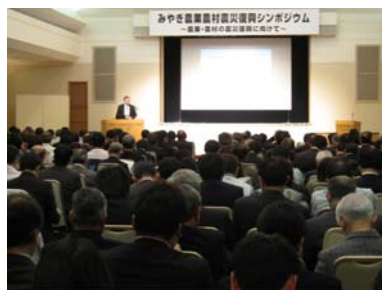
みやぎ農業農村震災復興シンポジウム（仙台市）