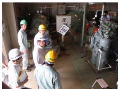
大川地区で視察を行う村井知事（石巻市）