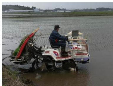
H24作付再開農地での田植え（東松島市）