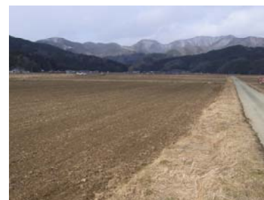
被災農地の復旧状況（石巻市）