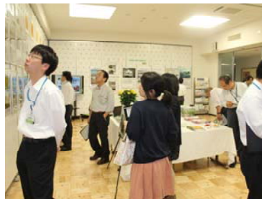
農水省「消費者の部屋」パネル展示（東京都）