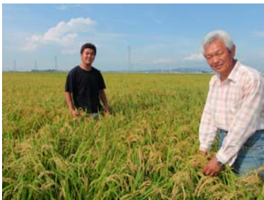
H23春除塩農地での水稲生育状況(石巻市)