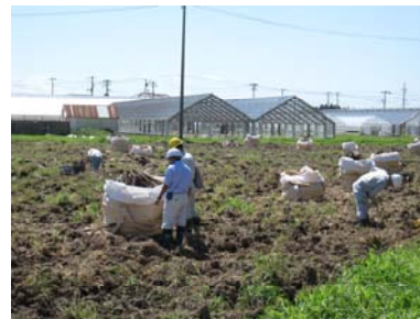
応援職員の活躍:ガレキ処理の確認(名取市)