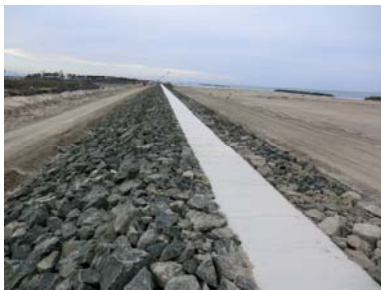
農地海岸の2次復旧完了(亘理町)