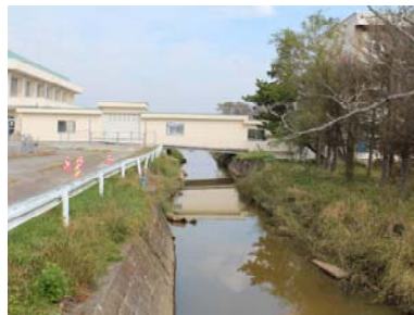
廃棄物処理後の農業用水路(亘理町)