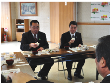
H24産復興米試食会（仙台市）