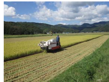
H24作付再開農地の稲刈り状況（石巻市）