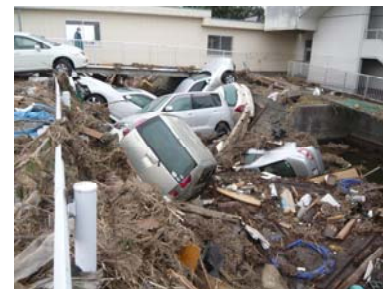
農業用幹線排水路の被災(亘理町)