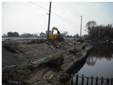
災害廃棄物の処理(名取市)