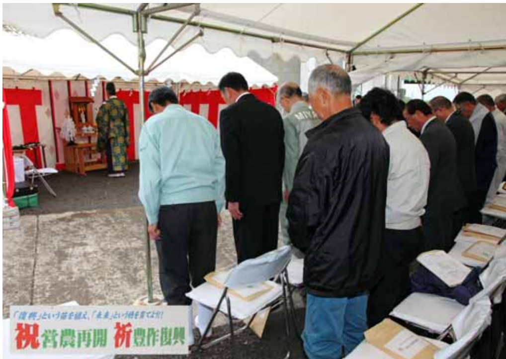
復興祈願祭の様子

なお、農地復旧を実施している宮城県東部地方事務所では、平成23年度に引き続き、平成25年度の水稲作付の再開に向けた農地復旧や除塩対策として、当土地改良区管内で約150ヘクタールの工事を実施する計画です。