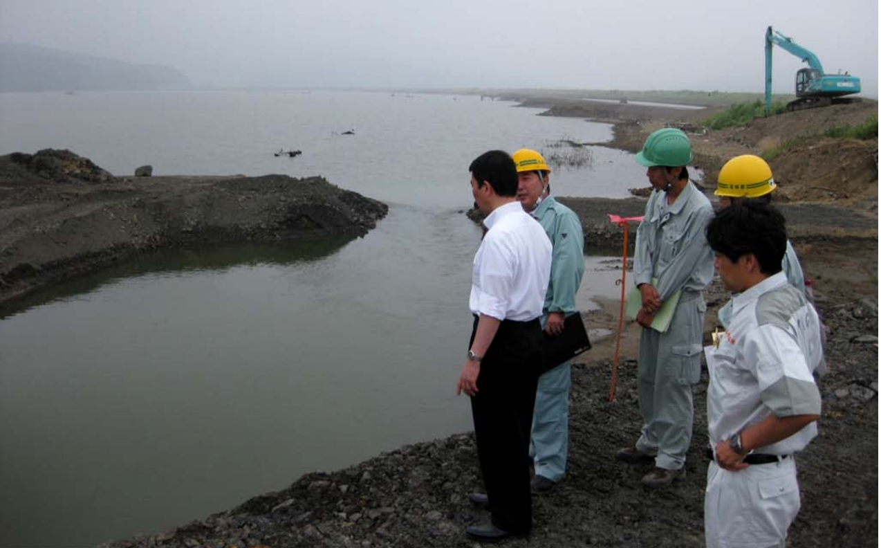
大川地区現場にて東部地方振興事務所担当者（左から2番目）から説明を受ける村井知事（左） =8月3日 石巻市