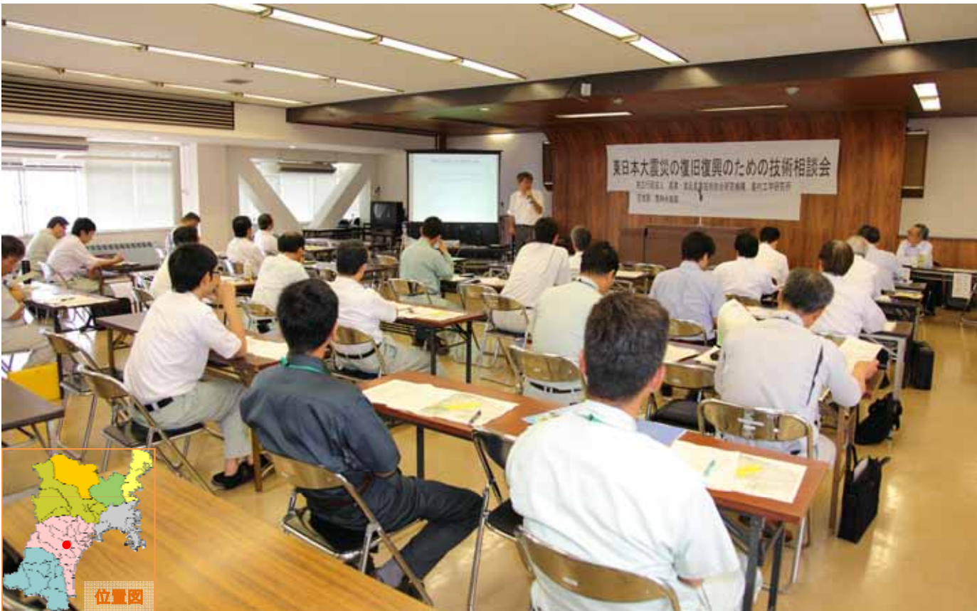
東日本大震災の復旧復興のための技術相談会