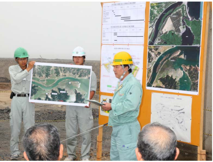
東部地方振興事務所担当者からの地元関係者への 工事内容説明