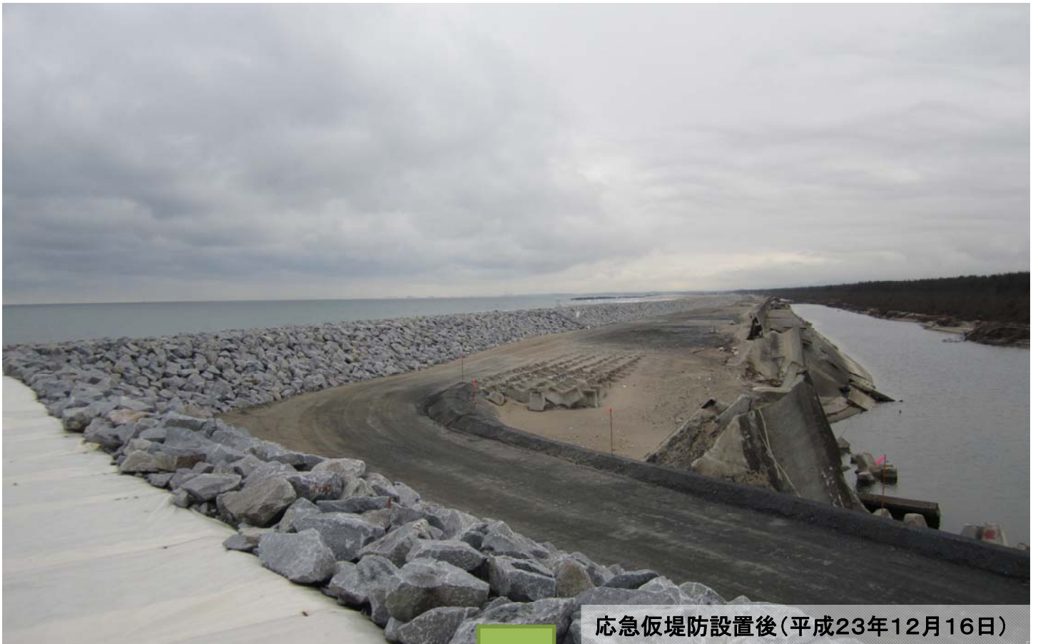
応急仮堤防設置後(平成23年12月16日)