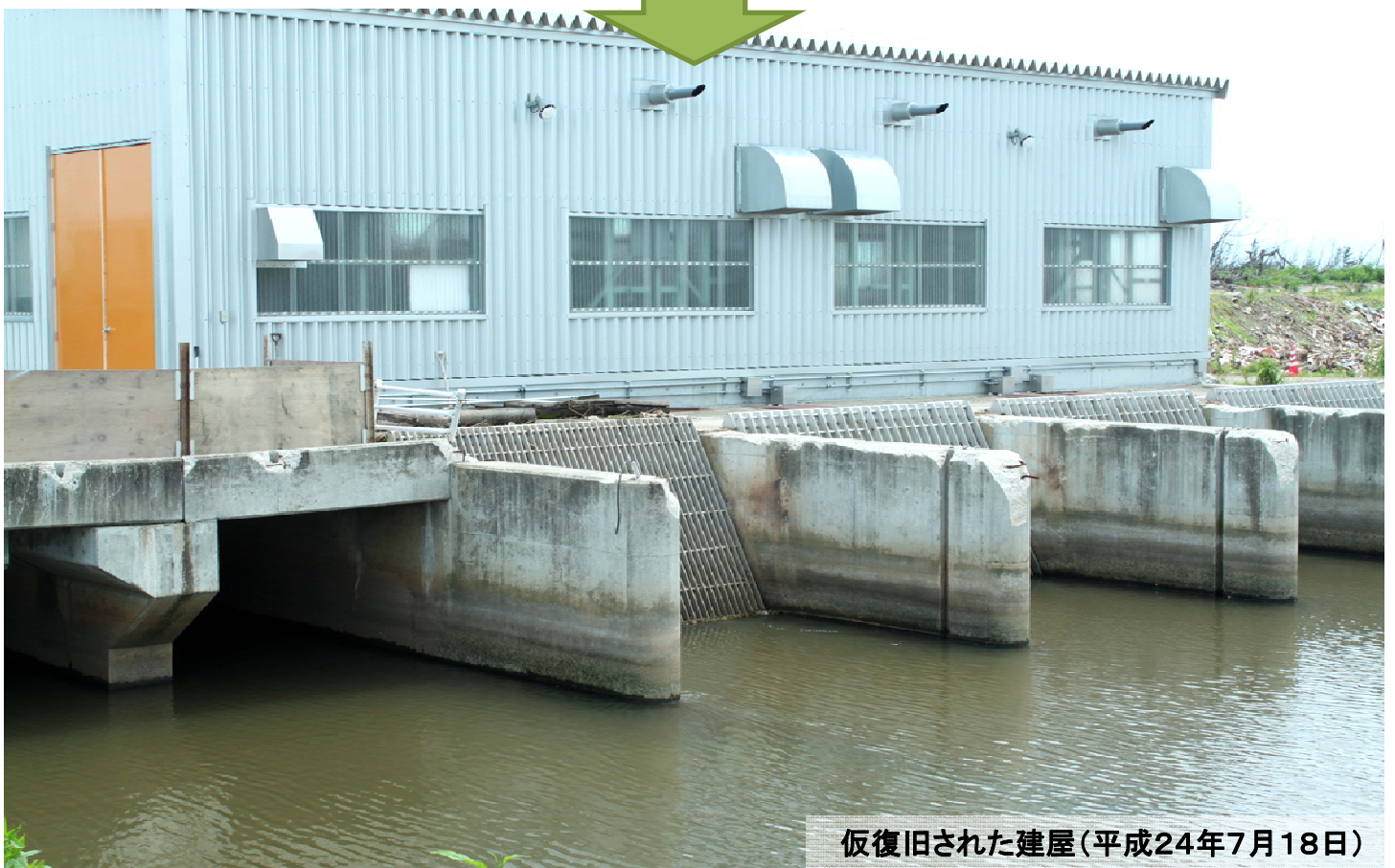
仮復旧された建屋(平成24年7月18日)

震災による津波で被災した農業用の排水機場で復旧対象となった47施設のうち、平成23年度は4施設が復旧、平成24年は7月現在で15施設の復旧に着手しています。なお、稼働しない排水機場は応急ポンプの配備等により対応しています。