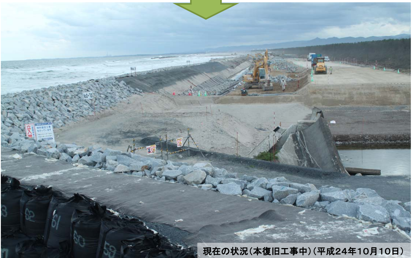
現在の状況(本復旧工事中)(平成24年10月10日)

震災による津波で、宮城県内の農地を守る海岸堤防のうち、26.5kmが壊れましたが、農林水産省東北農政局と県農林水産部では、平成23年度に本格的な復旧の前に大型土のう設置や応急仮堤防設置などを行いました。平成24年度からは、堤防の本復旧工事に着手しています。