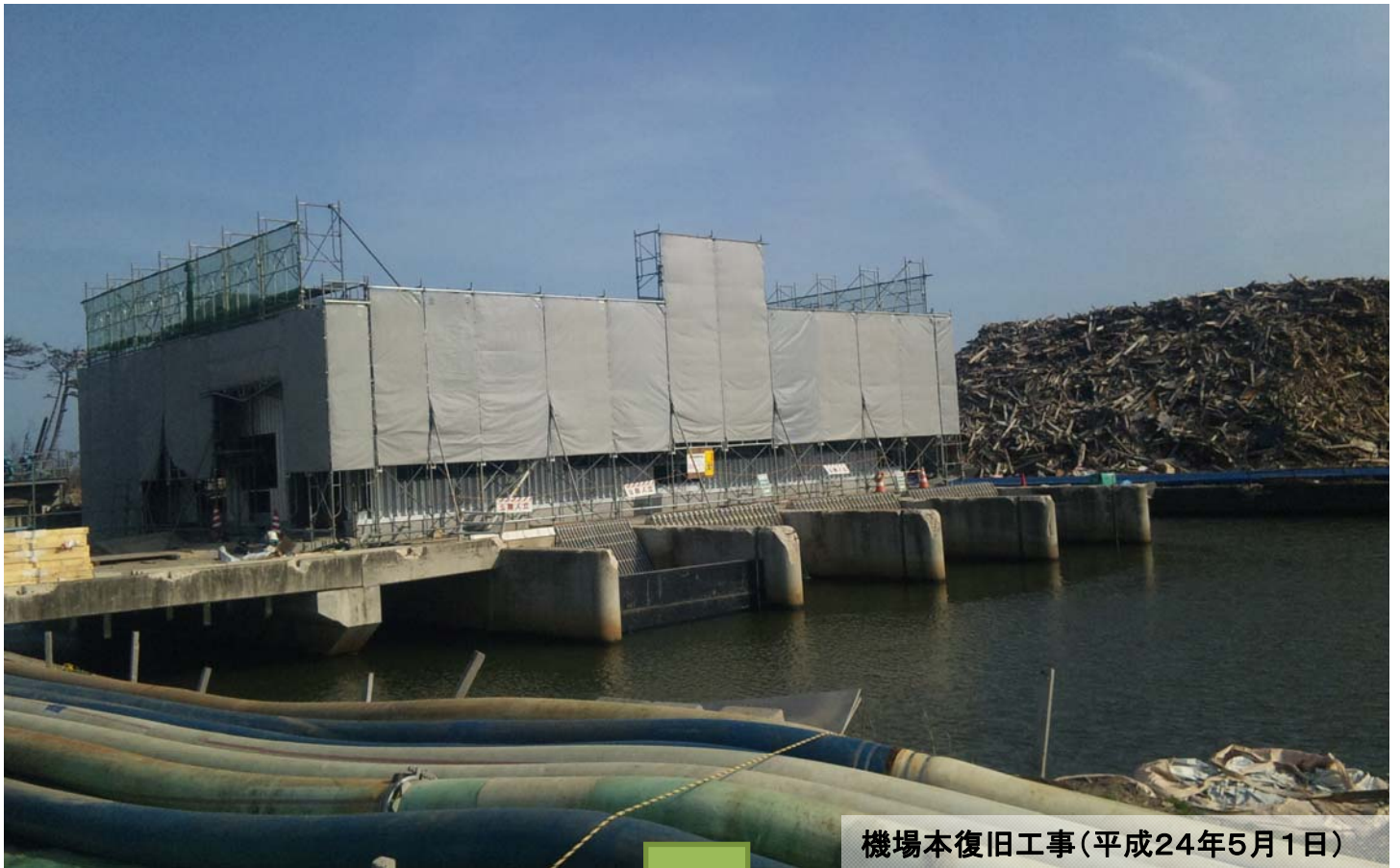
機場本復旧工事(平成24年5月1日)