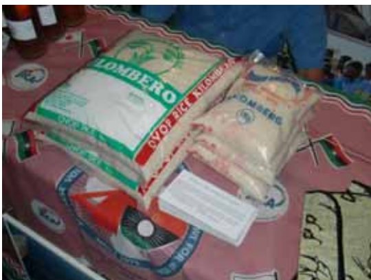
ブワンジェバレーライス(キロンベロ)

私の目標は、水管理組合の体制強化を図り適正な施設の維持管理を実現することです。そのためには、生産組合の収入が向上し、経営改善がなされることが重要になってきます。トレードフェアへの参加は、私たちにとって、今後の活動に向けて非常に有意義でした。