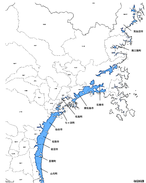
宮城県内の津波浸水区域

※上記には、復興交付金事業の内、農地整備事業及び復興基盤総合整備事業以外の事業(3地区)を含んでいる。