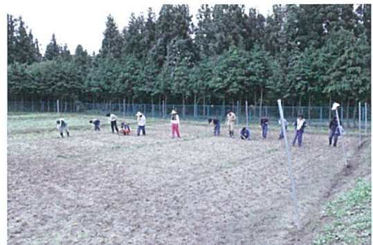
刈り取り後、落ち穂等の回収作業の様子