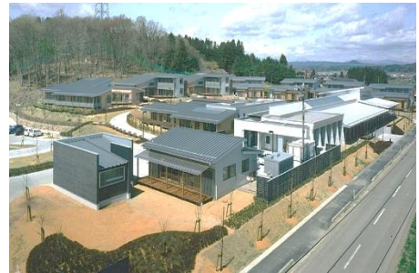
入所施設全景（栗原市金成）

入所施設では、日中活動の支援をはじめ食事や着替え、入浴の介助など、暮らしに必要な支援を行っています。通所施設では、栗原市指定ごみ袋の製造やパン工房や喫茶店などの運営を行い、活動する方の支援を行っています。そのほかにも、お祭りを模した縁日遊びや飲食店のテイクアウトを利用した食事会など、楽しい行事を取り入れ、利用される方々が穏やかな生活を送ることができるよう支援しています。