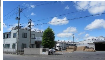
〈事務棟・工場外観〉

※ サイディングには、金属以外の原材料（セメントやガラスなど）を使うものがあり、これを「窯業系サイディング」と言います。