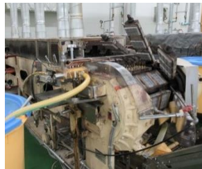
原料注入・焼き上げ