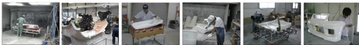
① 型に塗料樹脂を塗る ② 材料を塗り重ね成形（積層） ③ 型から抜く ④ 不要部分の除去（トリミング） ⑤ 組立て（アSEMBリ） ⑥ 仕上げ