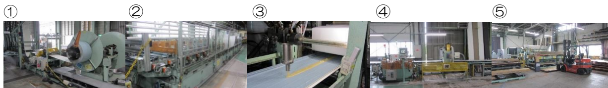
鉄板の供給 成形機による成形 ウレタン液の注入 製品の切断 製品の梱包

新入社員は⑤梱包部での梱包作業から仕事を覚えてもらいます。その後、経験を積みながら①鉄板の供給部及び③ウレタン液の注入部の仕事へとステップアップしていきます。