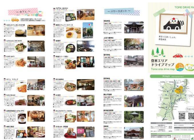
【ドライブマップ-表-】