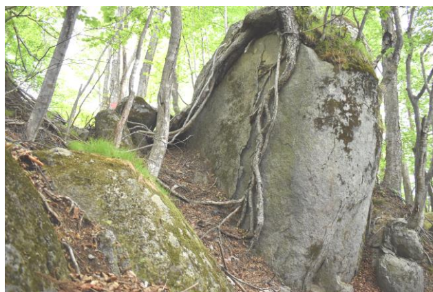
くわだいとうげ (写真:鋸台峠)

[モデルコース] 三陸鉄道「盛駅」⇒三陸鉄道「唐丹駅」⇒峠越え（羅生峠・鋸台峠）⇒三陸鉄道「三陸駅」 歩行：約19.3km 時間：6時間30分