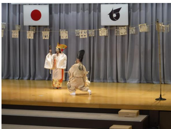
延年の舞披露の様子

当日は、国重要無形民俗文化財 毛越寺の延年の舞の披露や、陸上自衛隊東北方面音楽隊の演奏動画上映などが行われ、式典に華を添えました。