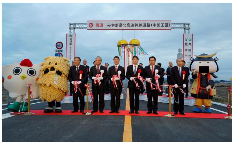
( 開通式の様子 )