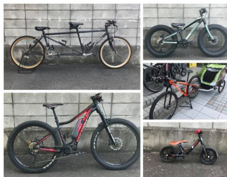
(試乗体験できる自転車の一例)