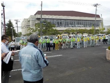
出発式の様子 (40名以上の方が参加しました)

毎年8月の「道路ふれあい月間」にあわせ、当事務所では宮城県建設業協会大崎支部との協働により、「道路クリーンキャンペーン」を実施しております。34回目となる今年は、8月26日に県管理の国道18路線約134kmについて、路上のゴミや空き缶拾い等の清掃活動を実施しました。また、実施区間のうち(主)仙台三本木線では、スマイルサポーターの皆さんにも参加いただきました。