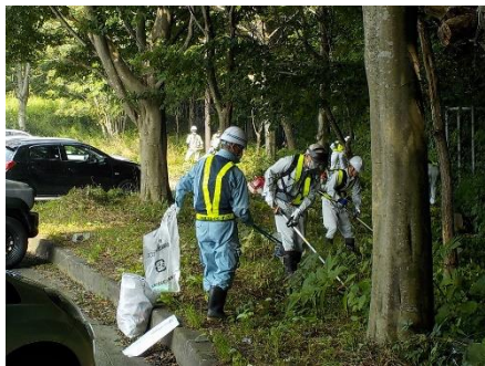
除草・清掃活動状況

8月6日には、今年で12回目となる清掃活動を行い、39名のボランティアの方々に参加いただきました。当日は、真夏日にも関わらず多数の方にご参加いただき、ありがとうございました。