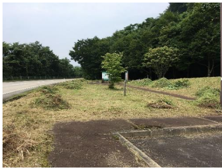
除草・清掃活動後

お問い合わせ：企画担当 0229-91-0735, 道路管理班 0229-91-0734