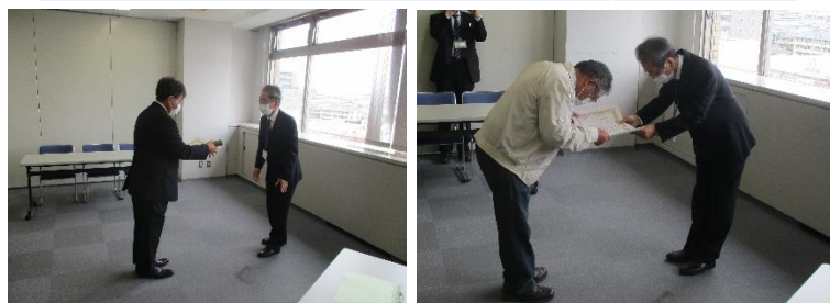
表彰伝達式の様子

当事務所管内では、スマイルロードサポーターが36団体、スマイルリバーサポーターが11団体活動いただいております。活動に関心や意欲のある方(個人、団体を問いません)の募集を随時受付しておりますので、お気軽にお問い合わせ願います。