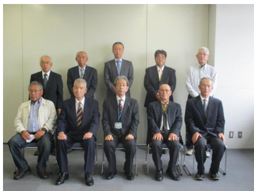
受賞されたみなさん