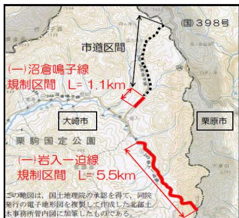
(一)沼倉鳴子線・(一)岩入一迫線 冬期間通行規制(通行止め)区間