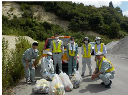
(主)仙台三本木線 清掃後

お問い合わせ：企画担当 0229-91-0735, 道路管理班 0229-91-0734, 行政班 0229-91-0732