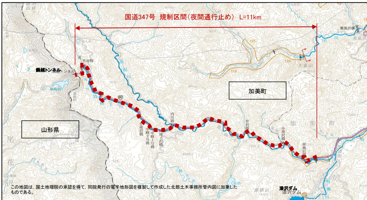
国道347号 冬期間通行規制(夜間通行止め)区間