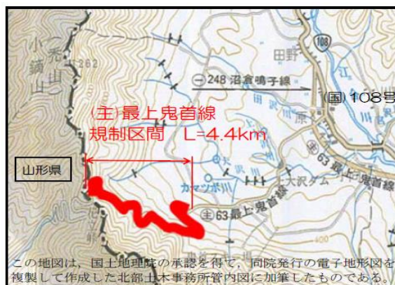
(主)最上鬼首線 冬期間通行規制(通行止め)区間