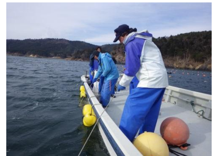
② 調査風景（サンプル採取）