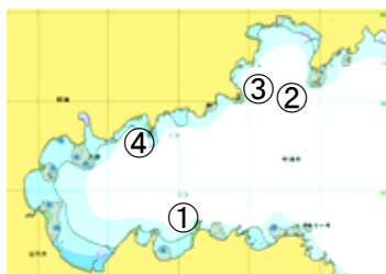
図 調査点(鮫ノ浦湾)