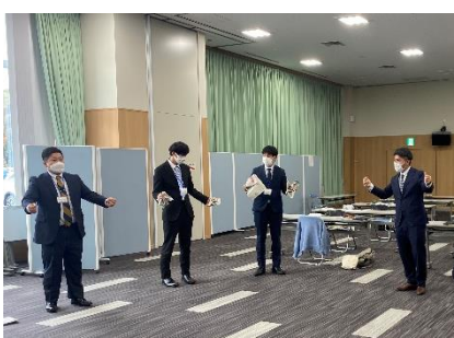
○講義・演習「運動の楽しさを感じ、自ら考え挑戦しようとする体育科の授業づくり」