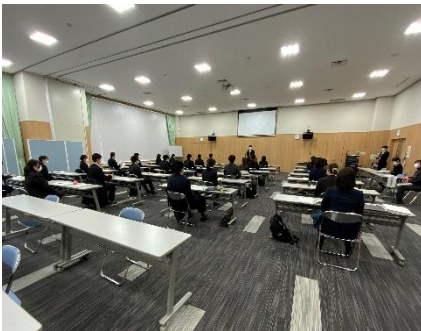
○初任研事務所研修 最後の所長講話