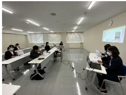
○研究成果発表の様子