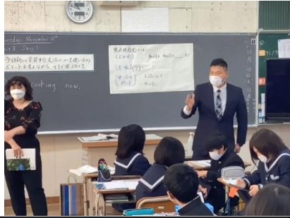
○授業動画視聴（英語科）