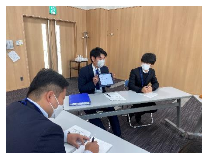
○研究協議 「こんな授業を目指したい」