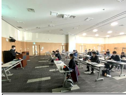
○講義・演習 「道徳科の授業づくり」