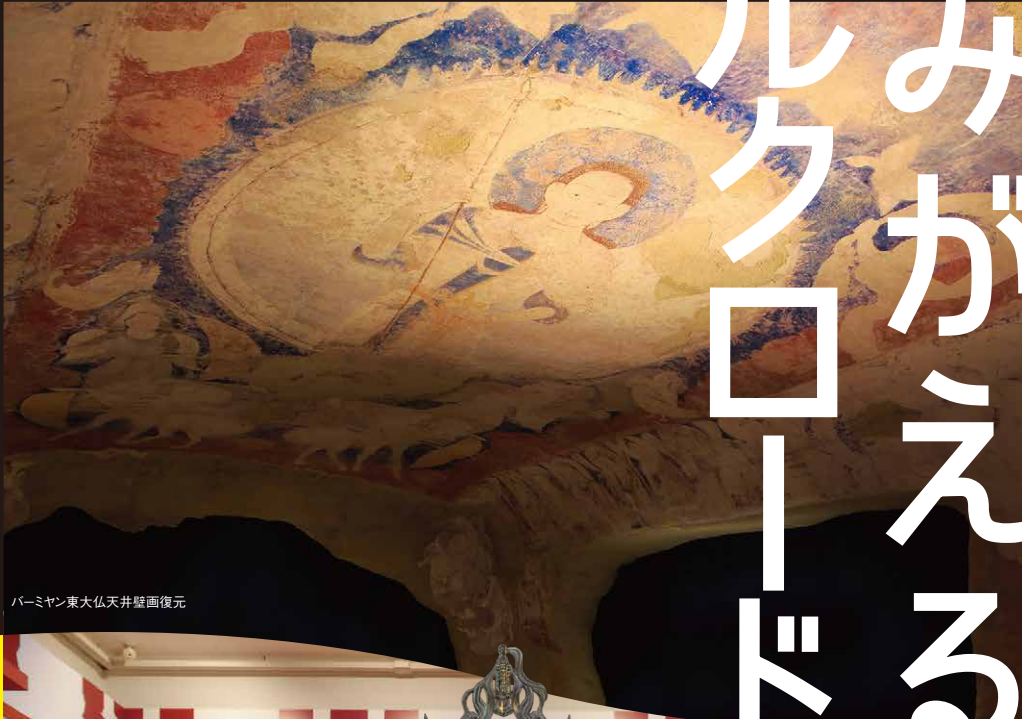
バーミヤン東大仏天井壁画復元