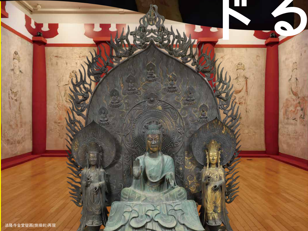
法隆寺金堂壁画(焼損前)再現